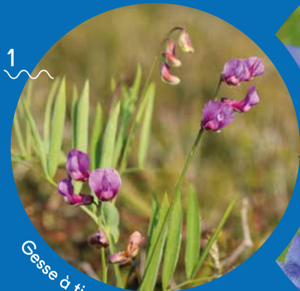
Gesse à tige nue

*Habitaten fitxei eta babestu beharreko espezieen fitxei buruzko xehetasun gehiago: http://natura2000.mnhn.fr